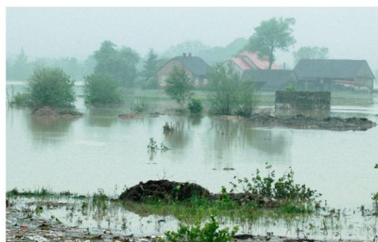
Wisła zalała domostwa w pozbawionej wału części Dworów Drugich dwukrotnie w 2010 r.

– Pierwsze konsultacje odbyły się dwa tygodnie wcześniej. Jeden z mieszkańców wniósł swoje zastrzeżenia do projektu, które teraz zostały uwzględnione. W konsekwencji projektowany wał zostanie przesunięty od 20 metrów, bliżej