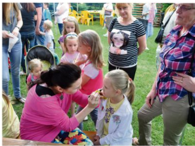
(lor)