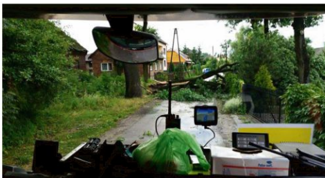
Babice, ul. Różana.

– Szanowni Państwo, po nawałnicy, która nawiedziła Małopolskę przed dwoma dniami, prądu zostało pozbawionych kilkadziesiąt tysięcy osób. Odpowiednie służby usuwają szkody systematycznie, pracując 24 godziny na dobę. Przyjęły sztywny klucz postępowania – najpierw usuwają szkody tam, gdzie jest zagrożone życie, potem usuwanie są szkody związane z dzia-