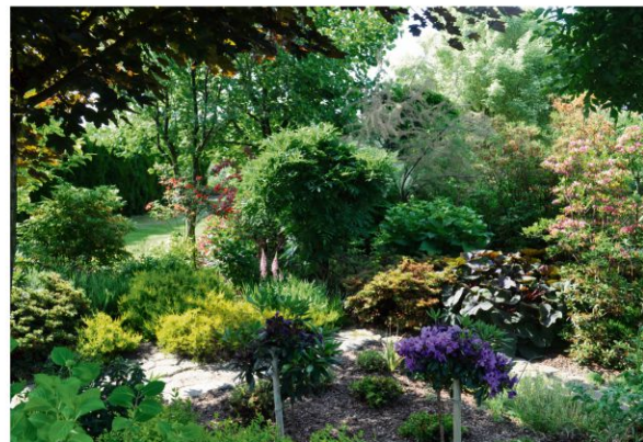
Zwycięski ogród w Brzezince.

– Nasz ogród zajmuje ponad 30 arów. Powstał kilkanaście lat temu, gdy przeprowadziła się tu moja córka, która pomaga mi w jego prawidłowym utrzymaniu – powiedziała nam Irena Nagi. – Żeby doprowadzić go do wyglądu jaki pan teraz widzi potrzebna było mnóstwo czasu i energii. Ale to człowieka cieszy – dodaje z satysfakcją pani Irena, zapraszając wszystkich zainteresowanych do obejrzenia jej pięknego ogrodu przy ul. Leśnej w Brzezince.