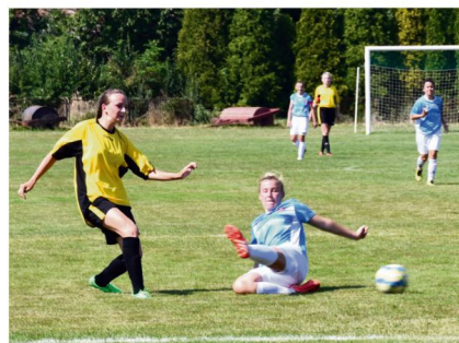
W pierwszej rundzie kobiecych rozgrywek Pucharu Polski rywalkami Iskry Brzezinka będą futbolistki krakowskiej Bronowianki.

Rozgrywki trzeciej ligi grupy czwartej wystartują w ostatni sierpniowy weekend (26-27 sierpnia). O punkty walczyć będzie dwanaście kobiecych