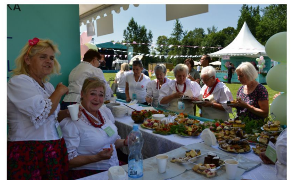
Stoisko porębianek na Festiwalu Smaku w Brzeszczach.

Oprócz tradycyjnych pokazów gotowania, stoisk wystawców i poczęstunku kół gospodyń wiejskich nie zabrakło warsztatów, zabaw i konkursów. Wydarzenie zwińczyły pokazy iluzjonisty, występ zespołu Megitza i okolicznościowy tort.