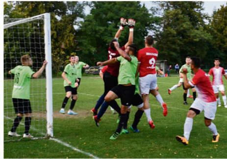
W weekend 12 i 13 sierpnia rozpocznie się nowy sezon piłkarski na boiskach oświęcimskiej klasy A i B.

Inaugurację nowego sezonu w rozgrywkach oświęcimskiej klasy A i B zaplanowano na 12 i 13 sierpnia. Letnia przerwa przedłuży się w Podolszu (klasa A) i Palczowicach (klasa B), bo te właśnie zespoły będą pauzowały w pierwszej kolejce.