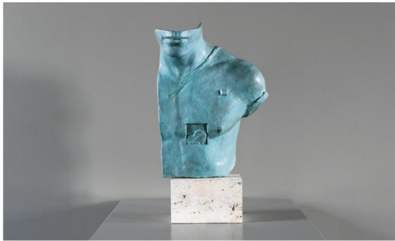
Rzeźba „Asklepios” Igora Mitoraja wita zwiedzających Muzeum Pamięci Mieszkańców Ziemi Oświęcimskiej.

W 1968 roku Igor Mitoraj przerwał naukę na ASP i wyjechał do Francji, gdzie kontynuował studia jako wolny słuchacz. W latach 70. otrzymywał coraz bardziej prestiżowe propozycje wystaw, dzięki czemu zyskał uznanie