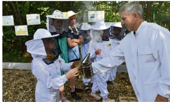
W Harmężach dzieci poznały pracowite życie pszczół.

11 lipca w Pasiece Ekologicznej w Harmężach miały miejsce warsztaty ekologiczne. Podczas zajęć z ekodoradcznią powiatu oświęcimskiego na uczestników czekały rebusy, łamigłówki i zagadki oraz zabawa plasty-