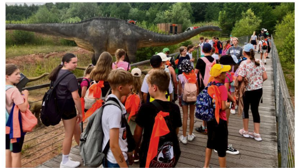
Najmłodszy mieszkańcy gminy odwiedzili Jura Park w Krasiejowie.

W Ogrodzie Zoologicznym w Krakowie 10 lipca dzieci miały okazję podziwiać zwierzęta, spacerując po pięknych, zielonych terenach ogrodu.