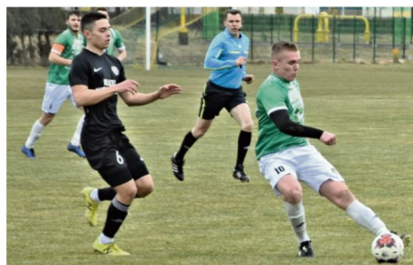
Piłkarze z Rajska zainaugurują nowy sezon wyjazdowym meczem z Victorią 1918 Jaworzno.